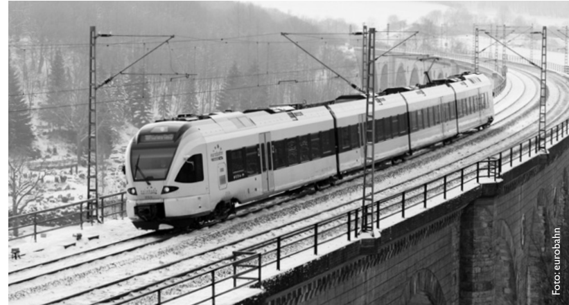
RB 89, Ems-Börde-Bahn, Münster – Hamm – Paderborn – Warburg (– Kassel-Wilhelmshöhe)

Sie können die Preise darüber hinaus an Fahrkartenautomaten für den jeweiligen Standort selbst ermitteln. Natürlich stehen Ihnen die DB-Reisezentren und Agenturen sowie die Kundenzentren der örtlichen Verkehrsunternehmen für sämtliche Auskünfte zur Verfügung.